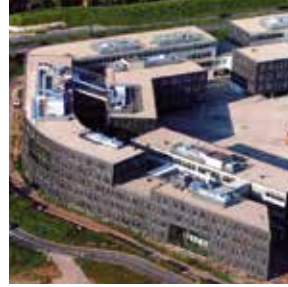
De Koppeling, Houten