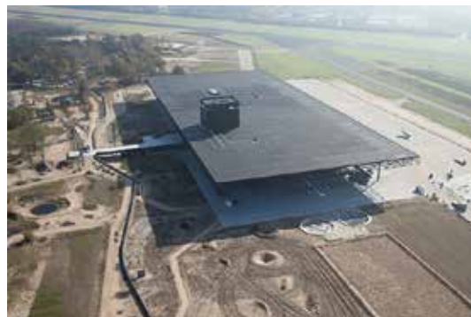
Militair Museum, Soesterberg